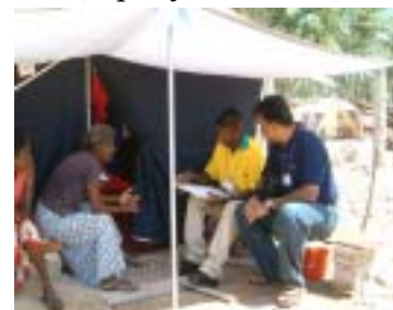
Interview to the affected people living in the tent

26 декабря 2004 года страны, расположенные на побережье Индийского Океана, стали жертвами землетрясения и сильнейших цунами, что указало на острую необходимость разработки системы раннего предупреждения цунами в Индийском Океане. Международная Стратегия Снижения Риска Стихийных Бедствий ООН (UN/ISDR) и ЮНЕСКО, ставшие основными инициаторами создания системы, подчеркнули важность повышения степени осведомленности населения о рисках стихийных бедствий (в частности о цунами и землетрясениях) для эффективного функционирования стратегии создания системы раннего предупреждения.