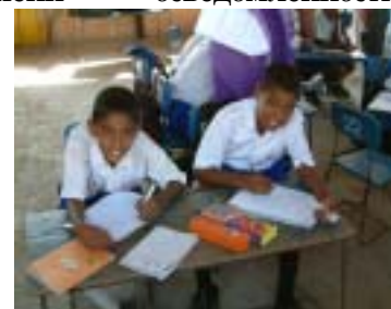
Children filling in the survey sheets (Habaraduwa)

Шри-Ланка является страной-членом Азиатского Центра Снижения Риска Стихийных Бедствий (ADRC), пострадавшей от цунами. ADRC разработал определённые меры для повышения степени осведомлённости резидентов о рисках стихийных бедствий. С целью последующего одобрения разработанных мер было проведено 2-х недельное (с 1-го марта по 14 марта 2005 года) исследование степени осведомленности о рисках стихийных бедствий населения в 6-ти территориальных единицах южной части Шри-Ланка.