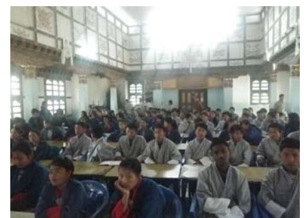
Школьники старшей школы