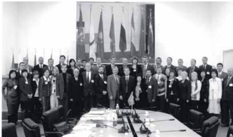
図4-3-3-1 中央アジア地域防災ワークショップ

UNDP との連携が目に見えて強化されたのは、国際復興支援プラットフォーム（IRP）の立ち上げに向けた準備の段階であります。UNDP は、2004年8月24日に東京の国連大学で開催した、復興に関するオープンフォーラムの共催者でもあり、UNDP の職員2名が講師としてこのフォーラムに参加しています。その後、世界会議の復興セッションでの協力、2005年5月に開催された IRP 発足を記念する国際防災復興協力セミナーの共催など、多くの事業を共同実施しています。IRP のリード的機関は UNDP であり、神戸にある事務局には UNDP の職員が2名配置されました。（IRP についての詳細は、6章参照）