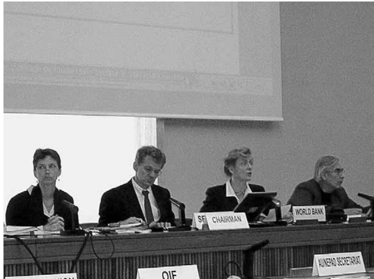
図4-3-1-1-1 第12回 ISDR タスクフォース会議

第11回タスクフォース会議ではまた、「兵庫行動枠組」の5つの優先行動の各分野における、関係機関のフォローアップ活動や支援の状況を把握するため、マトリックスを作ることを決めました。タスクフォースメンバーや関係機関からの情報提供を受け、ISDR 事務局は第12回タスクフォース会議開催（2005年11月22日－24日）までに案を提示しました。