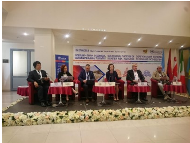
中央アジア・南コーカサス地域防災会議

https://www.preventionweb.net/files/57668_finalyerevandeclarationeng26.06.18.pdf