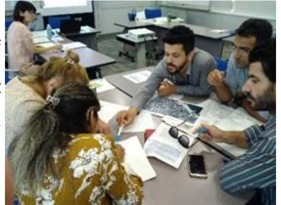
防災教育ツールを使ったワークショップ

アジア防災センター (ADRC)は、2019年9月2日から13日にかけて、JICA関西と協力し、トルコ国別研修「防災教育」コースを実施しました。本コースは、日本の知見と経験を共有し、トルコにおける学校防災教育の包括的な教員トレーニングシステムを更に強化することを目的に実施されました。トルコ国民教育省 (MoNE) および学校教員計14名が参加しました。