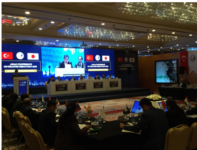
セッション2の様子

2019年11月25日から27日にかけて、トルコ政府、日本政府、ADRCの共催により、アジア防災会議2019（ACDR2019）がトルコの首都アンカラで開催されました。本会議にご参加いただきました皆様に、厚く御礼申し上げます。本会議の詳細は、次号のADRCハイライトでお知らせいたします。