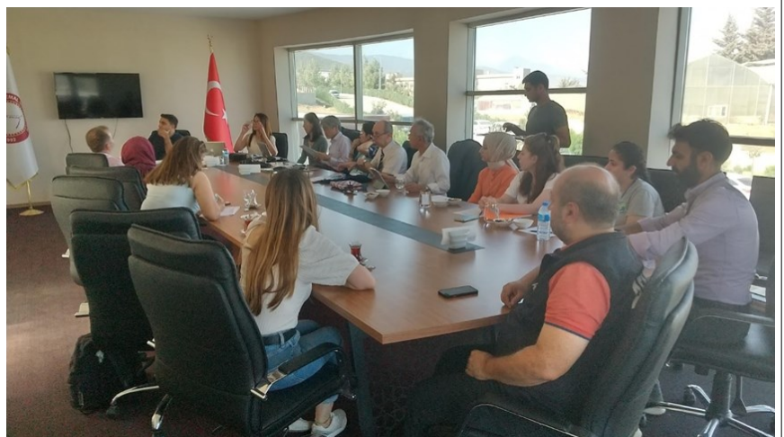
ワークショップの様子（ハタイ県）