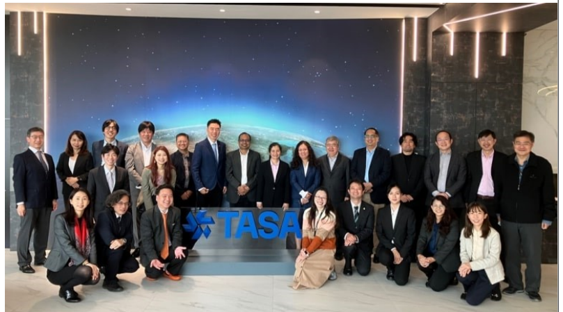
運営委員会の参加者

会議においては、JAXAから会合の趣旨、センチネルアジアの運用の現状と課題等の説明がありました。その他、各国宇宙機関から運用の現状等の発表、アジア工科大学