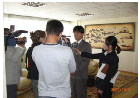
Телевизионное Интервью г-на Сузуки