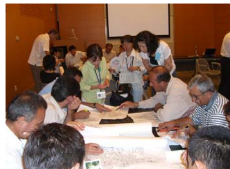
Составление Карт Риска