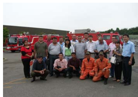
База Управления Стихийными Бедствиями Татикава Токийский Департамент Пожарной Безопасности

С целью получения общего представления и более глубокого понимания японской системы управления рисками стихийных бедствий, ролях системы, компетенции и межинституционального сотрудничества в рамках системы участники прослушали курс лекций и посетили правительственные организации, научно-исследовательские институты, метеорологическую