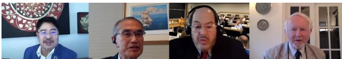
20 октября :Основные доклады