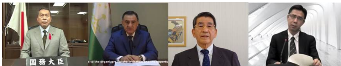
20 октября :Церемония открытия, специальные презентации

Азиатская конференция по снижению рисков стихийных бедствий (ACDR) 2020 была впервые проведена в онлайн-формате 20-22 октября 2020 года. ACDR - это ежегодно организуемое мероприятие, целью которого является содействие обмену информацией и опытом реализации Сендайской рамочной программы (SFDRR) и работы по достижению целей устойчивого развития (SDGs), а также дальнейшее расширение партнерства в области снижения рисков стихийных бедствий между странами-членами ADRC и различными международными и региональными организациями. ACDR2020 была организована совместно правительством Японии и ADRC. В виртуальной ACDR2020 приняли участие 244 человека из 22 стран-участниц, представляющих организации по СРБ, исследовательские институты, университеты и частные организации. Повестка дня состояла из церемонии открытия, специальной презентации, основных выступлений и двух тематических сессий.