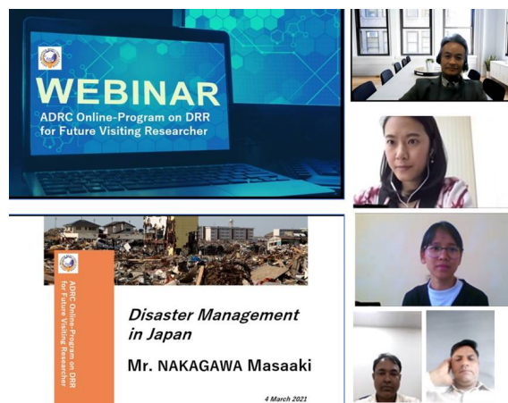
Вебинары этого года с внештатными научными исследователями

проводилась с февраля по март 2021 года и состояла из нескольких лекций на такие темы, как, управление рисками стихийных бедствий в Японии, продвижение школьного образования в области снижения рисков стихийных бедствий, система глобальных идентификационных номеров стихийных бедствий (GLIDE), повышение степени осведомленности людей о стихийных бедствиях, гендерный ракурс в управлении стихийными бедствиями и интеграция планирования восстановления после стихийных бедствий в планах по снижению рисков стихийных бедствий. Для широкой пропаганды программы VR официальные лица стран-членов ADRC были приглашены посетить эти онлайн-лекции и послушать их. С целью привлечения большего внимания общества к участию в онлайн лекциях были также приглашены официальные представители стран-членов.