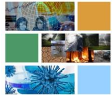
Asian Conference on Disaster Reduction 2020 Can We Adapt to the New Normal? - Approaches from Asia - Disaster risk reduction measures and challenges to the intensifying disaster risks Disaster preparedness and response measures under COVID-19

https://www.amazon.fr/dp/B091D5JMQ7 (France)