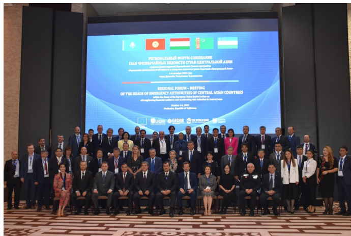
Региональный форум: Встреча глав государственных институтов по ликвидации последствий стихийных бедствий стран Центральной Азии

ADRC рассказал о реализуемых в настоящее время мероприятиях, способствующих наращиванию потенциала в странах Центральной Азии, такие как Программа стажировки внештатных научных исследователей, проект Страж Азии, система уникальных номеров GLIDE и подготовка к Азиатской конференции по снижению рисков стихийных бедствий (ACDR), которая в будущем пройдет в Таджикистане.