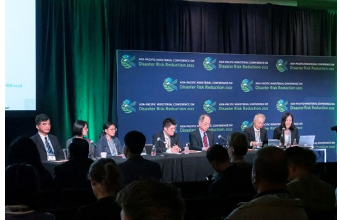
Партнерское мероприятие ADRC