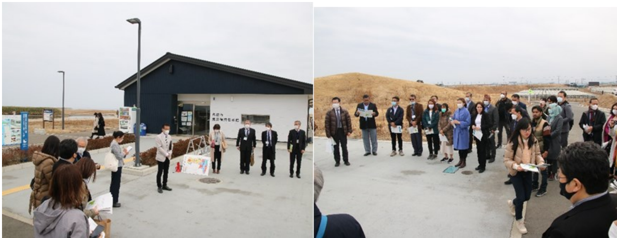
Объяснение губернатора города Натори г-на Ямада Сиро Перед Мемориальным музеем землетрясения

В Мемориальном музее землетрясения участники разделились на 2 группы. Каждая группа заслушала рассказ мэра города о процессе восстановления и о функционировании технического объекта для защиты от наводнений во время чрезвычайных ситуаций. Особый интерес вызвало объяснение мер по городскому планированию, разработанных после землетрясения и цунами. Было рассказано о резком сокращении населения после землетрясения и цунами и о последующем росте на фоне внедрения новых мер по городскому планированию.