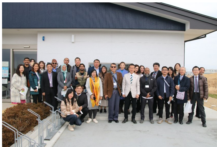
Участники выездного мероприятия

Далее участники последовали к каналу Тейзан и району, где находится муниципальное жилье для пострадавших. Здесь они непосредственно смогли увидеть, насколько поднят уровень суши, каким образом устроены площадки для экстренной эвакуации в случае цунами.