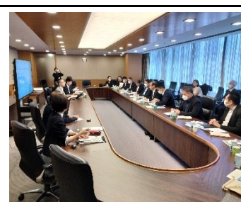
Японская государственно-общественная центральная телерадиокомпания