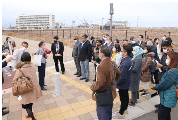
Посещение канала Тейзан и района муниципального жилья для пострадавших

Разрешите еще раз поблагодарить всех, кто оказал поддержку при проведении экскурсии и всех, кто принял участие в Азиатской конференции по снижению рисков стихийных бедствий 2022.