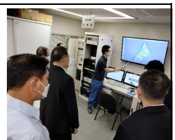
Офис администрации города Сумида