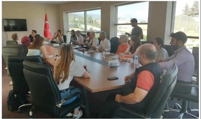
Семинар (провинция Хатай)

Казалось, что учителя все еще находятся в состоянии глубокого горя, но при этом они очень много работают, открывая школы, продолжая обучать и заботиться о детях. Министерство образования старается поддержать психическое здоровье и оказать психосоциальную поддержку учителям и детям, направляя в пострадавшие регионы специалистов и проводя семинары для детей и учителей, однако с точки зрения долгосрочного восстановления необходима постоянная поддержка учителей и учащихся школ. Кроме того, крайне важно переосмыслить образование в области стихийных бедствий, опираясь на опыт произошедшего в 2023 году землетрясения. ADRC создаст возможности для обмена связанным со стихийными бедствиями опытом Турции и Японии посредством обмена информацией и сообщениями между учителями и детьми.