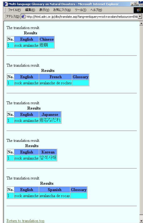
図 2-4-4-2 対応する 5ヶ国語の翻訳語表示

今後は、用語の語彙データを増加させること、ロシア語を新たに加えるなどで、自然災害に関するより一層の情報共有を促進させるものとしていきたい。