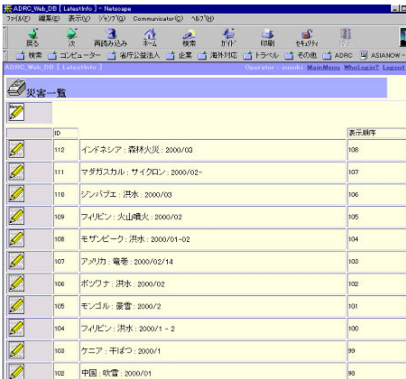
図5-1-1-1最新災害情報編集 第1画面

図5-1-1-1は、ユーザー名とパスワードを入力し、最新災害情報の編集を選んだ直後の画面である。ここでは、既に入力済みの災害の一覧が表示されるため、これらの災害の情報を追加訂正する場合にはリストから該当する災害を選び、新しい災害を追加する場合には「new」をクリックすることになる。図5-1-1-2は、「new」をクリックした後の、新しい災害を入力する画面である。新しい災害が発生した場合は、この画面に従い、災害発生国(メニューから選択、データベースにはISOコードが格納される)、災害種別(複数選択可)、災害名称(日英)、災害期間(日英)、概要(日英)を入力していけば良い。データの作成日付、更新日付は自動的に格納され、データの作成者、更新者についてもログインの際の情報を基に自動的に追加される。これらの作業は、すべてインターネット経由でどこからでも行うことができ、2-2で述べたように、台湾の地震の際には発生が深夜であったにもかかわらず、4時間後に情報発信が開始された。